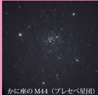
かに座の M44 (プレセペ星団)

M44(プレセペ星団)は、双眼鏡でも見ることができる美しい星団です。しし座とふたご座の中間付近に位置しています。この M44 に 6 月 2 日頃には火星が、6 月 12 日頃には金星が接近します。接近する火星や金星を目印に探せば比較的簡単に探せます。