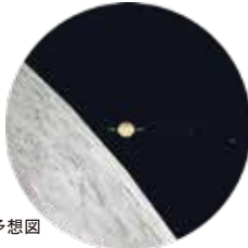
最接近する 18:22 ごろの予想図

12/8日 月と土星大接近観望会 時間 17:00 ~ 19:00 せんだい宇宙館付近では、 18:22を中心に月と土星が 大接近して見えます。 宇宙館の大望遠鏡で観望 します。