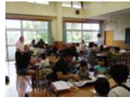
(写真は、2019年に実施した工作の様子)

● 7/21日 宇宙館科学工作 「組立天体望遠鏡」 要予約: 6/28金 受付開始 定員: 25名 × 午前・午後(2回) 於: 少年自然の家